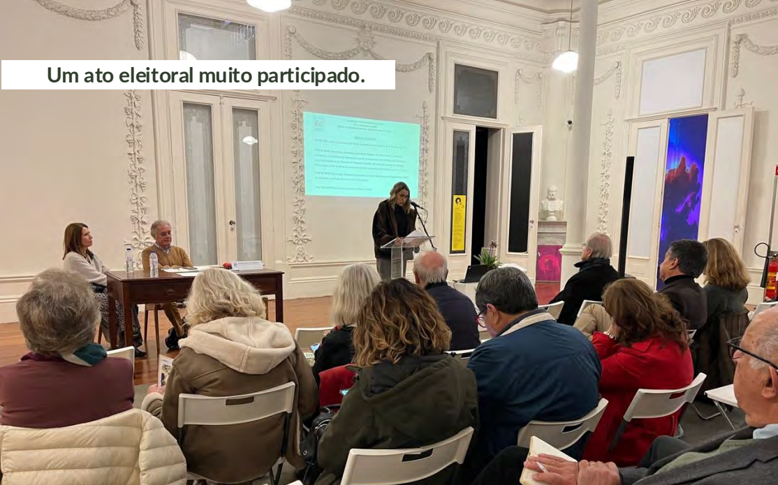
Uma nova Direção para 2026-2028